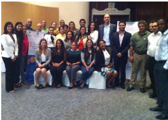
Participantes del Taller.

Para más información sobre este proyecto y sus talleres pueden contactar a su coordinador en República Dominicana, Jose Carlos Fernández, en su correo electrónico jose.fernandez2@giz.de.