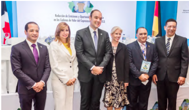
Participantes de la Mesa de Honor.