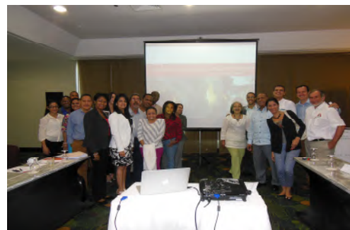
Participantes del Taller de Co-Procesamiento.

El desarrollo del curso se basó en la presentación de conceptos teóricos, complementados con experiencia práctica extraída de casos reales en diferentes países, principalmente de América Latina y Europa, bajo la conducción de Andrés Jensen, experto internacional con experiencia en el manejo, tratamiento y co-procesamiento de residuos.